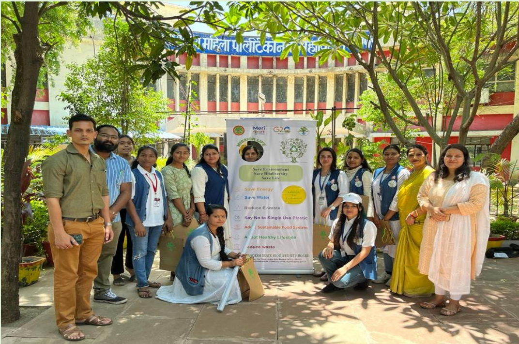
महिला पॉलिटेक्निक कॉलेज भोपाल में आयोजित मिशन लाईफ कार्यक्रम