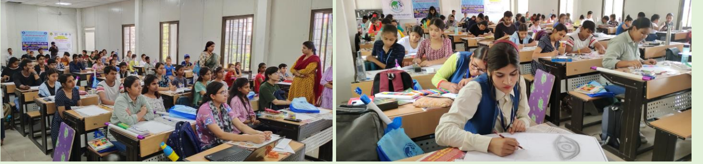
दिनांक 10.05.2023 को चित्रकला प्रतियोगिता का आयोजन

कार्यक्रम के समापन अवसर पर बोर्ड की ओर से गौरेया संरक्षण हेतु नेस्ट बॉक्स वितरण, मानव श्रृखला निर्माण, शपथ ग्रहण, स्लोगन राईटिंग एवं पौधा वितरण किया गया।