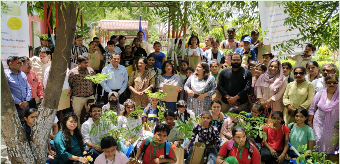
गौरेया संरक्षण हेतु नेस्ट बॉक्स वितरण, मानव श्रृखला निर्माण, शपथ ग्रहण, स्लोगन राईटिंग एवं पौधा वितरण किया गया।