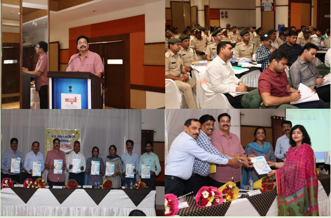
वनवृत्त जबलपुर में आयोजित जैवविविधता जागरूकता कार्यशाला (दिनांक 16.06.2023)

कार्यशाला के अंत में उपस्थित अधिकारी एवं कर्मचारियों तथा मैदानी अमलों के साथ विचार विमर्श किया गया। कार्यशाला में वनवृत्त जबलपुर अंतर्गत जबलपुर, कटनी, डिण्डौरी, पूर्व मण्डला एवं पश्चिम मण्डला वनमंडलों के वनमण्डलाधिकारी, वनपरिक्षेत्र अधिकारी, वन रक्षक, पी.आई-कोपीआई, मास्टर ट्रेनर्स, जैवसंसाधनों का व्यापार करने वाले व्यापारी एवं पर्यावरणविद् सहित 75 प्रतिभागी सम्मिलित हुये।