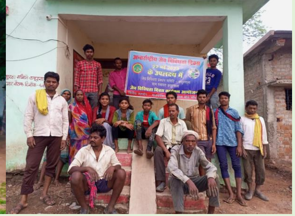
जैवविविधता प्रबंधन समिति— पंचायत नौढ़िया, जनपद पंचायत –मझौली जिला सीधी म.प्र. अंतर्राष्ट्रीय जैवविविधता दिवस 22 मई 2023 के अवसर पर जैवविविधता कार्यक्रम का आयोजन किया गया।