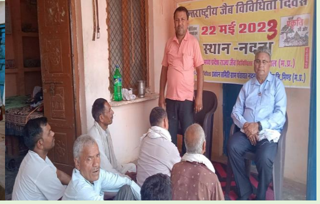
जैवविविधता प्रबंधन ग्राम— पंचायत नदना जिला – भिण्ड द्वारा जैवविविधता दिवस कार्यक्रम का आयोजन किया गया।